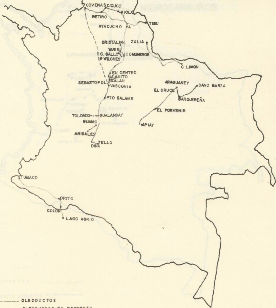
Fig. No. 1