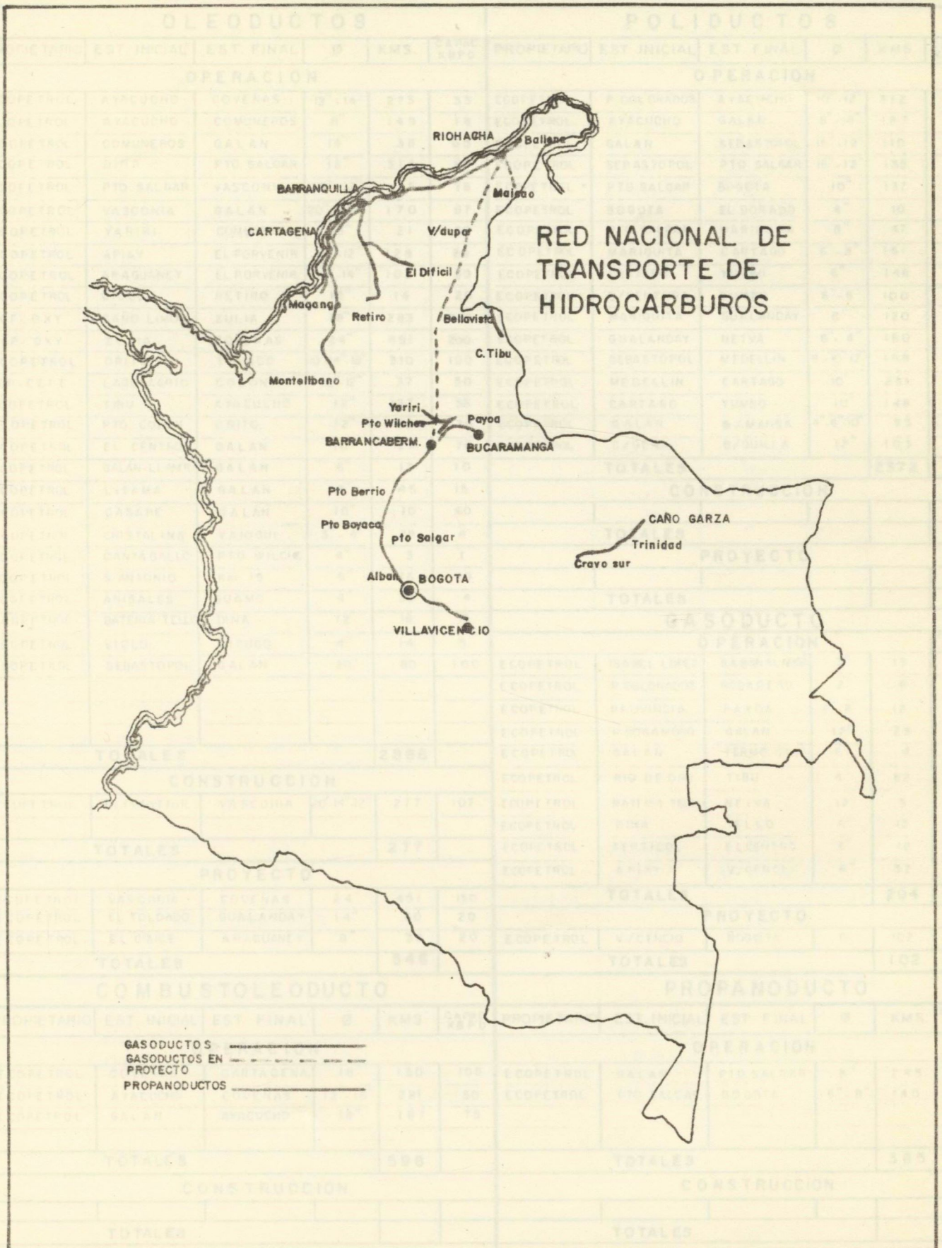
Fig. No. 3