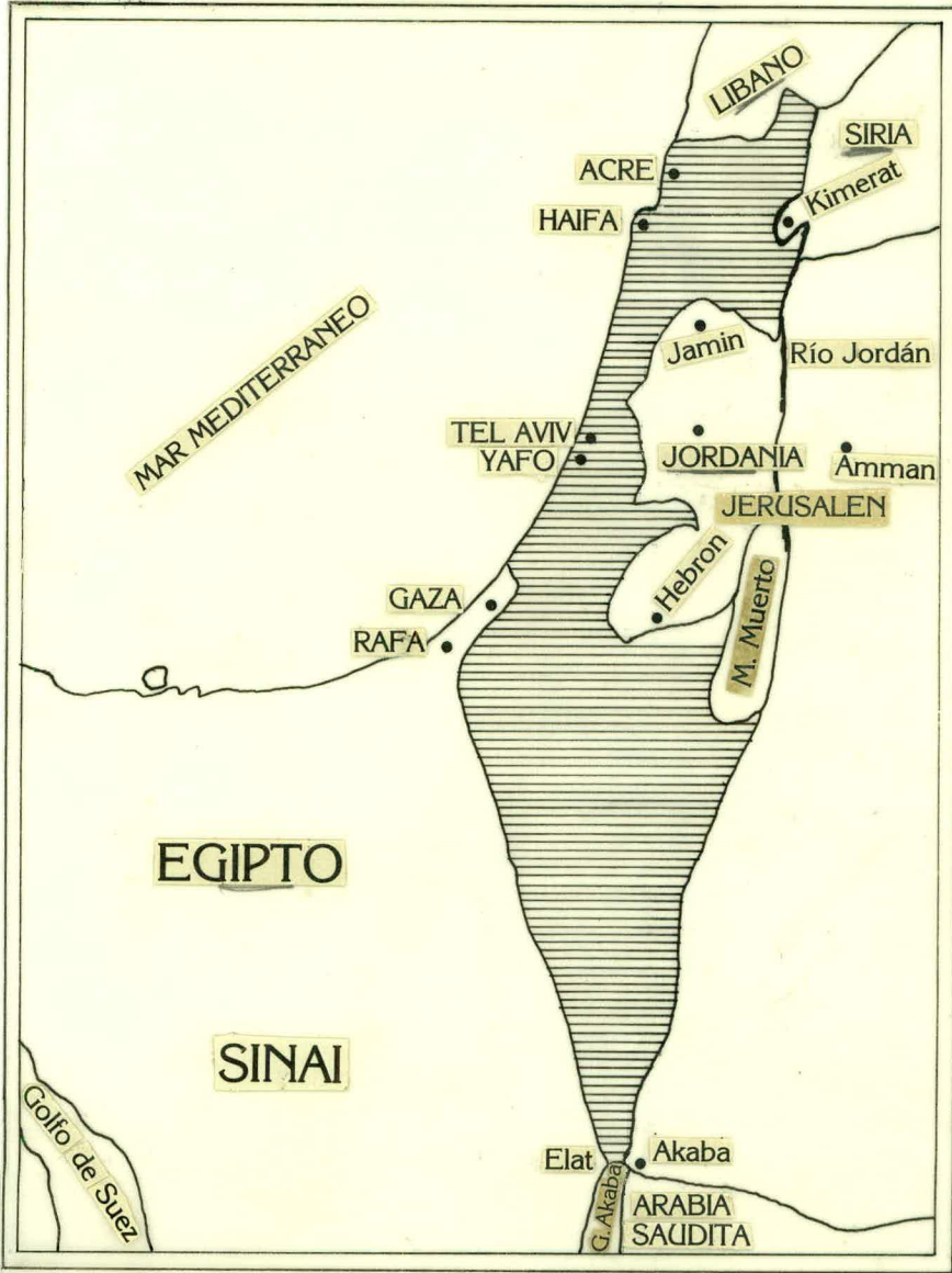
MAPA No. 4