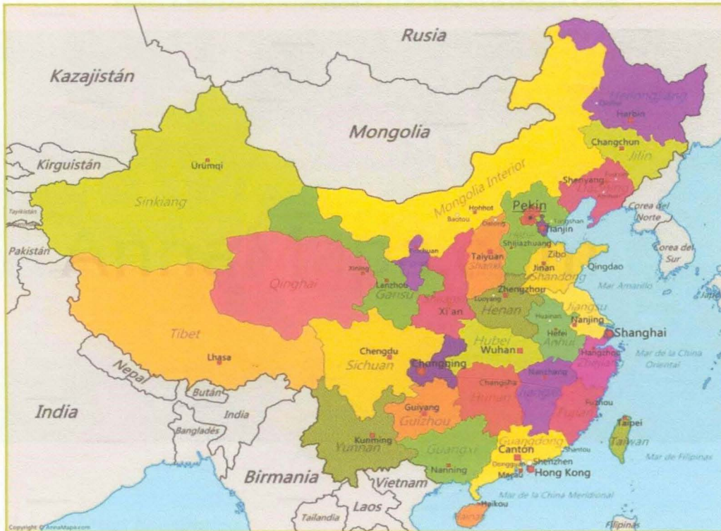
Figura 2. Mapa división política China