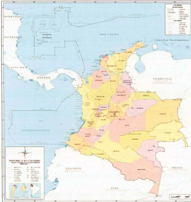
Figura 6. Ubicación geográfica Colombia