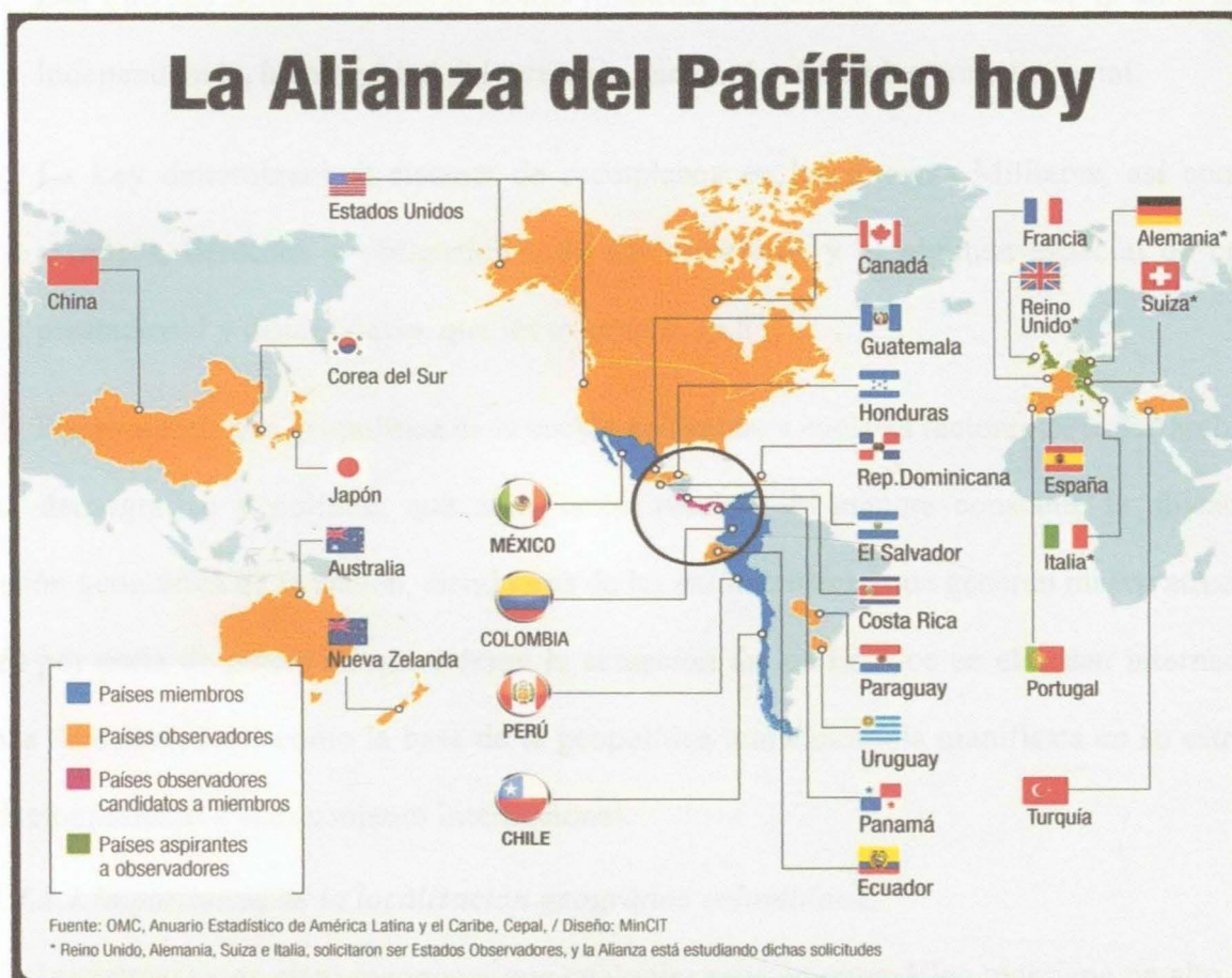
Figura 5. Alianza del Pacífico