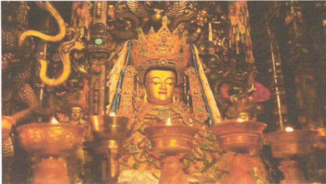
Figura 3. Imagen representativa de la historia de la religión China