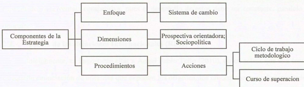
Figura 1. Componentes de la estrategia