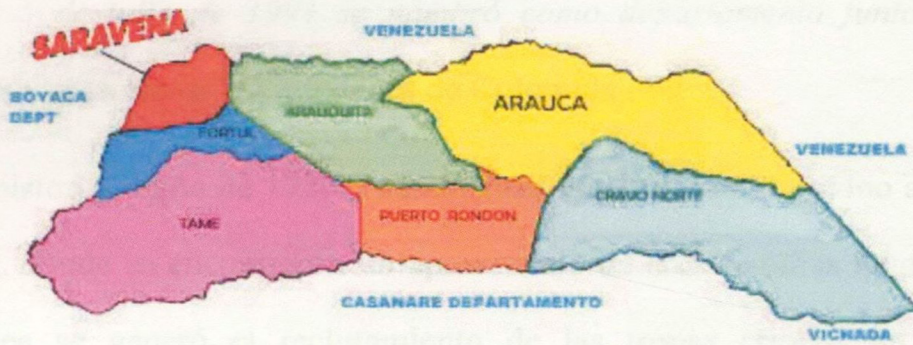
Mapa 1 División política de Arauca

Los municipios araucanos han sido víctima de los grupos al margen de la ley, la violencia infringida contra la población ha sido de grandes magnitudes, debido a las riquezas naturales que poseen estos municipios.