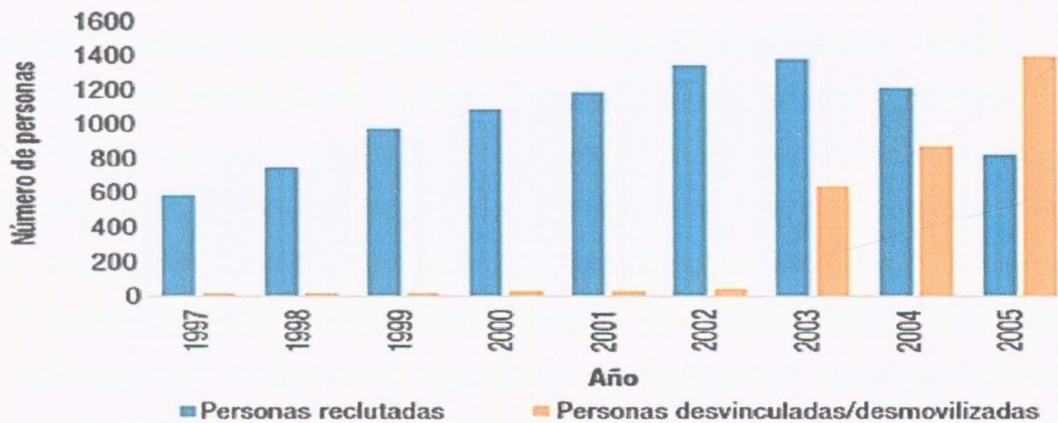
Figura 1. Niños, niñas y adolescentes reclutados y desvinculados/desmovilizados, 1997-2005.

Fuente: Colombia, CENTRO NACIONAL DE MEMORIA HISTÓRICA, CNMH, Una guerra sin edad. Informe nacional de reclutamiento y utilización de niños, niñas y adolescentes en el conflicto armado colombiano, 122 (Centro Nacional de Memoria Histórica, CNMH Bogotá, 2017)