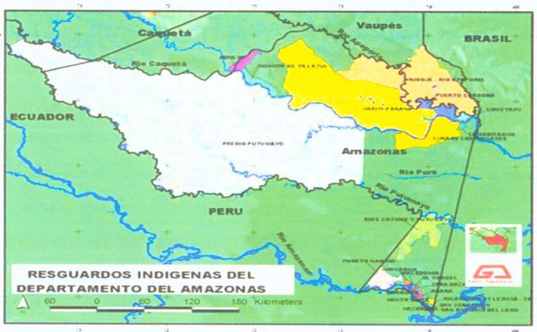
Mapa 1 Región del Amazonas

la región amazónica incluye alrededor de 400 000 km 2 de la cuenca hidrográfica del río, que comprende el 36 por ciento del territorio nacional. El cultivo de coca se concentra en la Amazonía occidental, en los departamentos de Guaviare, Caquetá y Putumayo donde se ha convertido en una parte integral de la economía nacional e internacional, coincidiendo con el crecimiento acelerado de la población: la región La población es de 800 000 personas, o el 80 por ciento de la población de toda la región amazónica. Esta es también el área de mayor deforestación. La producción se rige por el mercado y los alimentos se valoran como bienes comercializables. En cambio, en el este de la Amazonía, la población sigue siendo menos densa y los indígenas continúan practicando principalmente la producción de subsistencia. (Ramírez, 2017)