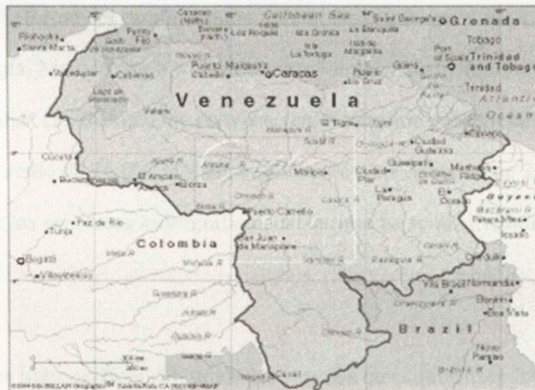
Figura 4. Ubicación de recurso hídrico compartido.

Recurso hídrico en Colombia. Uno de los países con mayor número de recursos hídricos en el mundo es Colombia, ubicado al noreste de Suramérica, limitando con el mar Caribe al norte, con Panamá y el océano Pacífico al noroccidente, posee una frontera con Venezuela por tierra al oriente, caracterizada por la presencia de grandes sabanas, selvas húmedas, altas elevaciones donde se alojan páramos, aunada a la posición estratégica del país en el trópico, le dan a Colombia un importante potencial hídrico, donde dicho recurso está repartido heterogéneamente en las diferentes regiones del país; motivo por el cual, en el territorio existen sectores desprovistos de agua, hasta lugares con excesos, que se inundan periódicamente y en tiempo relativamente considerable. Como refleja el Mapa en la figura 4 ( GAIA: Environmental Information System, 2002 ), el recurso hídrico colombo venezolano puede ser motivo de tropiezo.