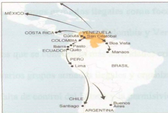
Figura 2. Rutas de la migración venezolana.

Por otro lado y relacionado con la migración de venezolanos, es importante destacar que durante décadas, el conflicto civil colombiano ha repercutido en el país vecino de Venezuela, nación a la que los ciudadanos colombianos huían desesperados de la violencia y en la que los actores del conflicto buscaban refugio. Hoy la ola humana fluye en dirección contraria y la integran venezolanos desplazados por la precaria situación económica y por la escasez de alimentos y medicinas en su país, buscando subsistir y dispuestos a trabajar, incluso en actividades ilegales por elementos que satisfagan sus necesidades esenciales como alimentos, vestuario, medicina, entre otras (OpenDemocracy, 2018).