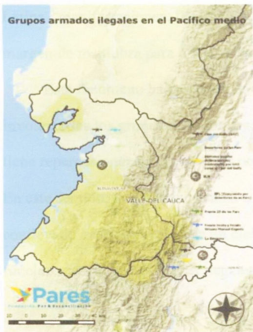
Figura 3: Grupos armados ilegales en el Pacífico medio

En cuanto al pacífico medio, esta subregión también se encuentra en una reconfiguración entre los grupos armados, especialmente en Buenaventura con el fin de hacerse al puerto para el narcotráfico, allí hay presencia de las Autodefensas Gaitanistas de Colombia, la Empresa, el ELN y un grupo desertor del extinto frente 30 de las FARC (Fundación Paz & Reconciliación, 2018). El siguiente mapa, ilustra la presencia de los grupos en esta subregión.