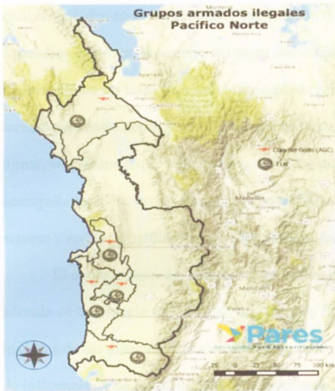
Figura 4: Grupos armados ilegales en el Pacífico Norte