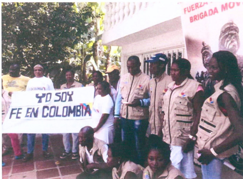
Figura No 5. Proyecto Piscícola Comunidad Guachené Cauca "Afrovivir mejor" (Fuerza de Tarea Apolo del Ejército) Mayo 2015