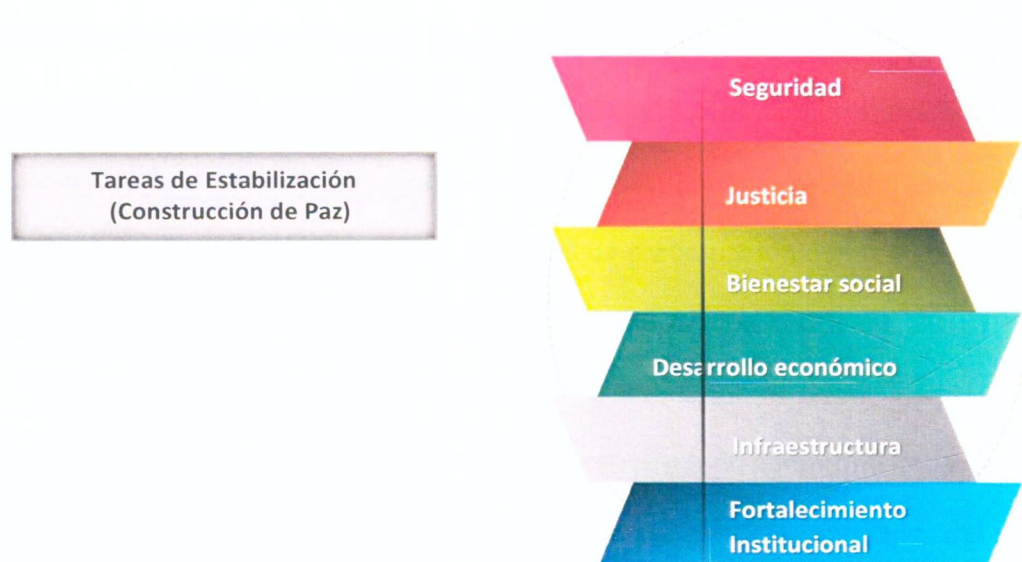
Figura No 3. Diseño – Tareas de Estabilización