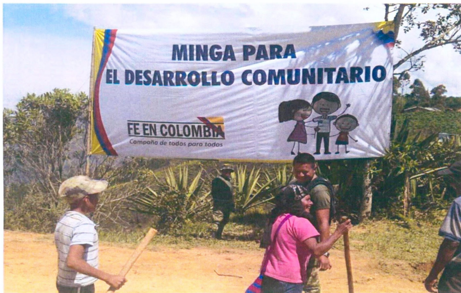
Figura 6. Minga para el desarrollo comunitario sector plan de Zúñiga Cauca Junio 2015 (Tercera División del Ejército)

Estas mingas son actividades cotidianas de las comunidades, que rescatan el trabajo en pro de un interés común como el mejoramiento de una vía, una recuperación de cuenca, jornadas de arborización entre otras.