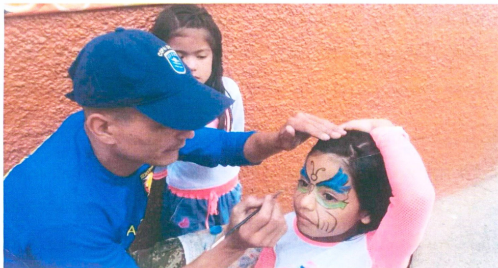
Figura No 7. Compañía de Acción Integral de la Tercera División Samaniego Nariño Abril 2015 (Tercera División del Ejército)

Todas estas actividades como iniciativas y compromiso de contribuir al desarrollo, el bienestar y la construcción de espacios de diálogo que permitan una sana convivencia y al mejoramiento de la calidad de vida de los hombres, mujeres, niños y niñas, mediante la generación de procesos, los cuales permiten la integración del Ejército Nacional como su amigo y como constructor de espacios de paz e inter-institucionalidad con ejercicios de articulación entre entidades como Instituto Colombiano de Bienestar Familiar, Unidad de Atención de Víctimas, Agencia Colombiana para la Reintegración, Unidad Administrativa de Consolidación, Oficina de Derechos Humanos de la Gobernación y Policía Nacional los cuales se integran para prevenir que nuestros niños, sean utilizados por los grupos y lleguen a la ilegalidad.