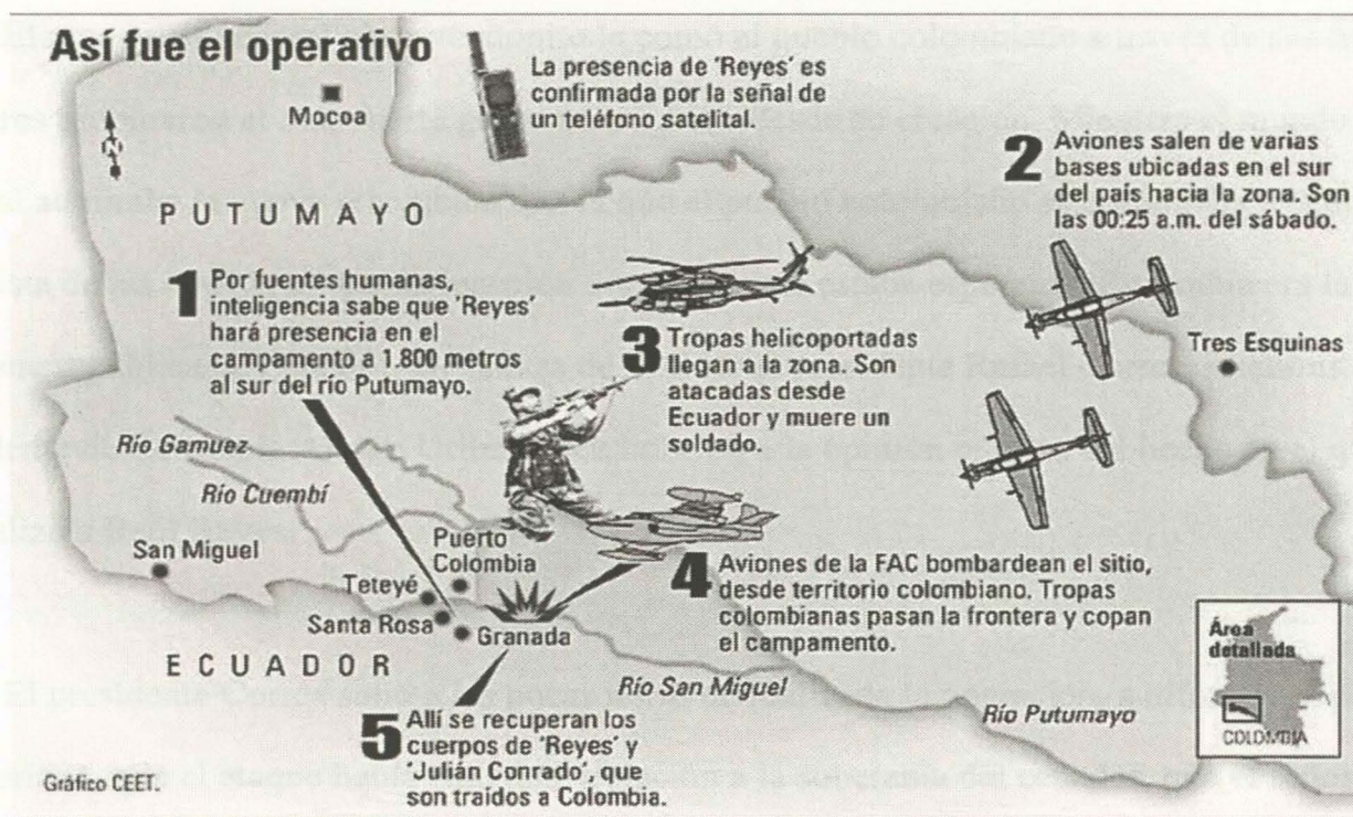
Grafico recuperado de web infomil.com

La maniobra de esta operación fue relativamente sencilla en referencia a otras que se han realizado el objetivo debía ser atacado a la hora h, los helicópteros despegarían H-30, los Súper Tucano H-47, el líder del escuadrón debía escoger un rumbo de entrada a el objetivo que asegurara no ingresar a espacio aéreo del Ecuador, los A-37 despegarían H-1:30, después de la entrega del armamento a la hora H los helicópteros dejarían a los comandos a la hora H+0:02 y posterior harían la extracción de lo que se requiriese del área de operación.