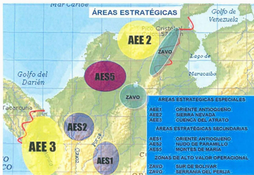
Figura No. 1 Áreas Estratégicas del CCON1.

Al CCON1 le fueron asignadas unas áreas estratégicas, una de ellas denominada Área Estratégica Secundaria No. 5, que corresponde a los Montes de María como se observa en la figura No.1.