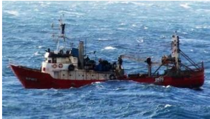
Figura 1. Miss María II en el Caribe colombiano

un procedimiento unificado ni apoyo forense adecuado, lo que afectó la identificación y entrega digna de los cuerpos(Morales, 2017).