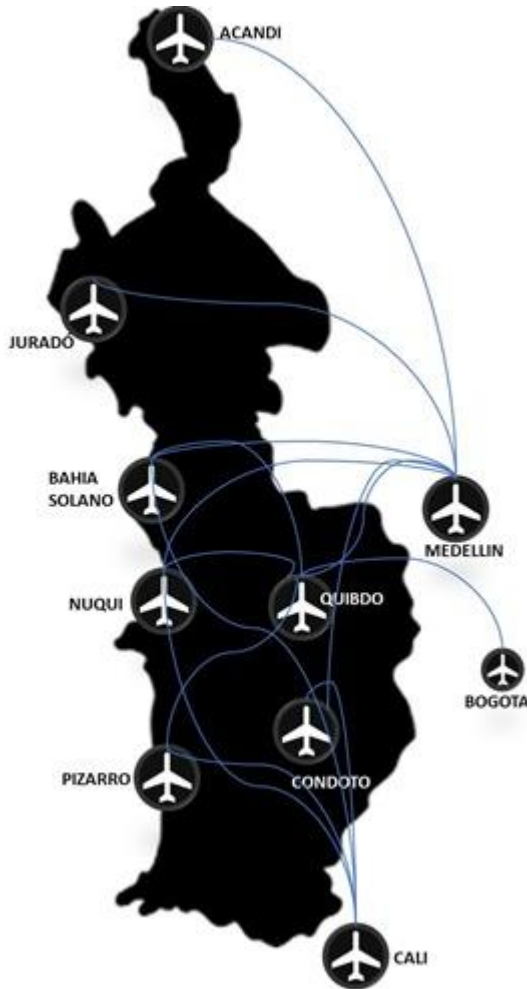
Figura 1 Cobertura aérea de SATENA en el Departamento del Chocó

Nota: Imagen de autoría propia elaborada con base en los datos operacionales de SATENA, la revisión documental del artículo académico de Vergara (2020), los informes institucionales del Ministerio de Transporte, y los estudios de Infante y Villa (2018) sobre la calificación de aeropuertos regionales.