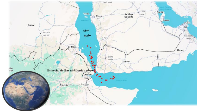
Figura 4. Incidentes marítimos frente a la costa de Yemen (2023–2024)