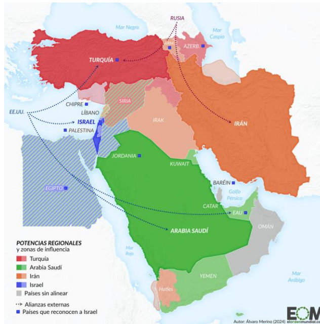
Figura 1. Potencias regionales y zonas de influencia en Medio Oriente (2024).