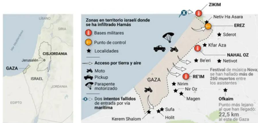
Figura 2. Zonas de infiltración de Hamás durante el ataque del 7 de octubre de 2023.

Hamás empleó tácticas de infiltración combinadas: drones para neutralizar torres de observación, excavadoras para abrir brechas en la valla fronteriza y comandos motorizados para avanzar en territorio israelí (Center for Strategic and International Studies [CSIS], 2023). Estas acciones sorprendieron a la inteligencia israelí y minaron la confianza pública en la disuasión del Estado.