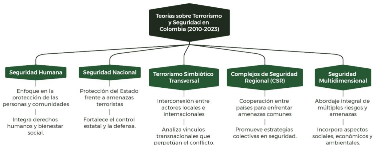
Figura 1. Enfoques teóricos sobre la relación entre terrorismo y seguridad en Colombia entre 2010 y 2023