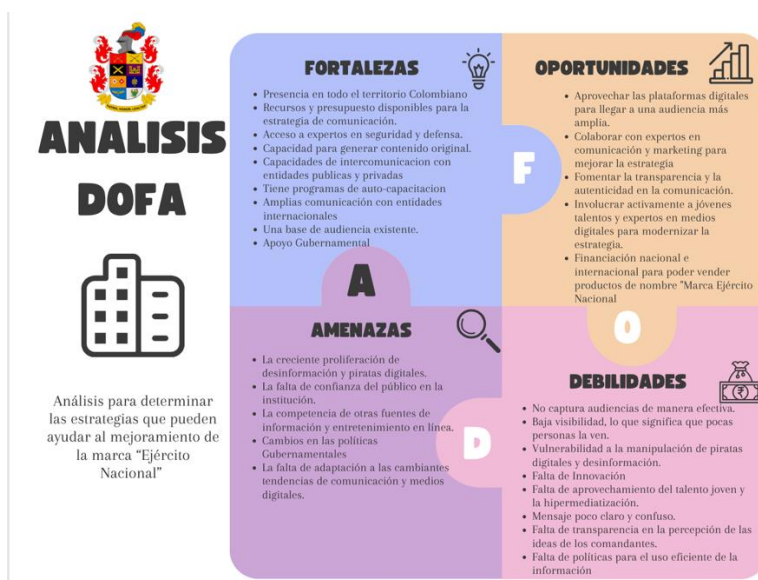
Figura 9 Matriz DOFA para la creación de la marca Ejército Nacional