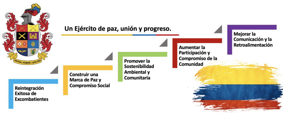
Figura 11 Objetivos para la estrategia de transformación digital y participación comunitaria del Ejército Nacional

Con el propósito de establecer la hoja de ruta que permita dar cumplimiento a la estrategia se ha establecido centrar la misma en 5 objetivos claros que permitan ser materializados durante la ejecución de la misma, ver figura 9.