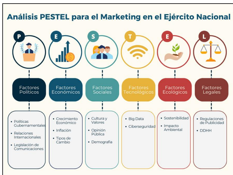
Figura 3 Análisis PESTEL para el Ejército Nacional en la estrategia de marca