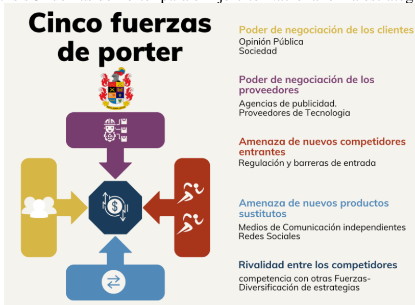
Figura 4 Análisis 5 fuerzas de Porter para el Ejército Nacional en la estrategia de marca