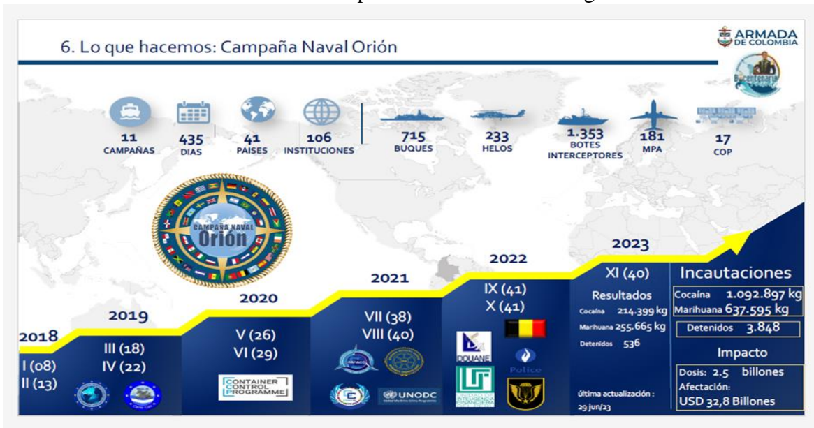
Grafica 1. Resultados de la Campaña Naval Orión a lo largo de su historia