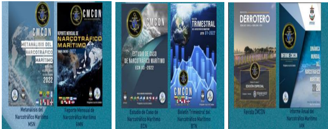
Imagen 1. Principales Publicaciones del CMCON

elaborando nuevos planes operaciones (Sugerencias), al alto mando de la Armada de República Dominicana (ARD), informes y otros documentos de interés (Abreu, 2023).